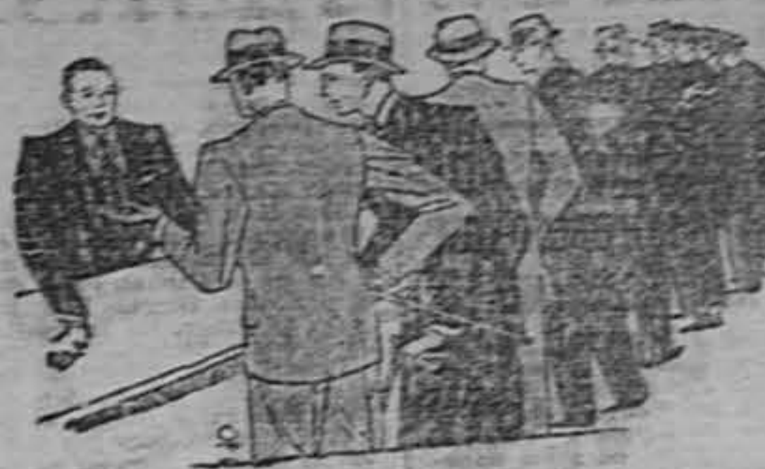
porque puede usted hacerse contento con un lindo corte de casimires