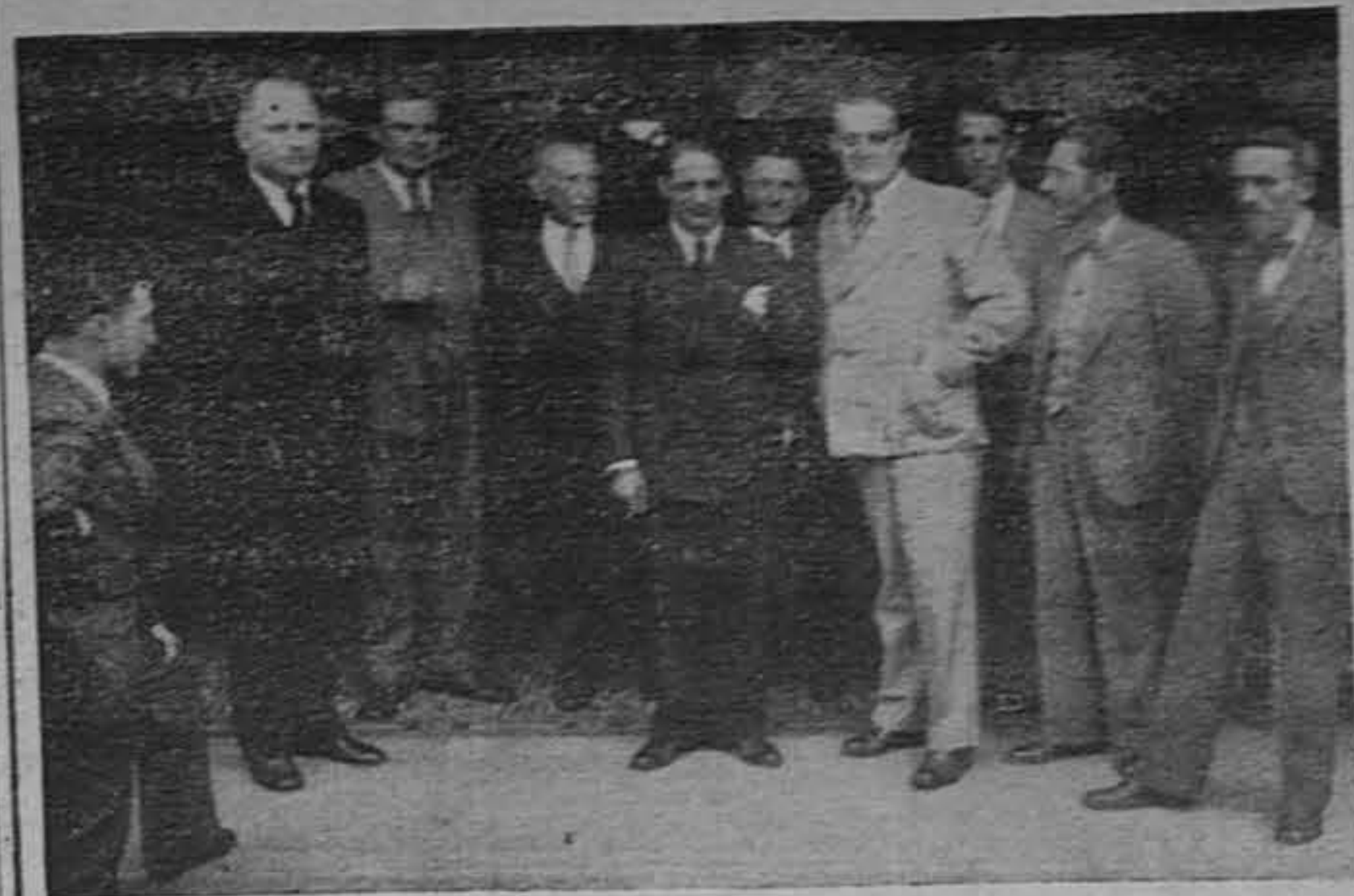
El Dr. Jorge Eliecer Gaitán... visita que hizo ayer a la redacción del DIARIO DE COSTA RICA...