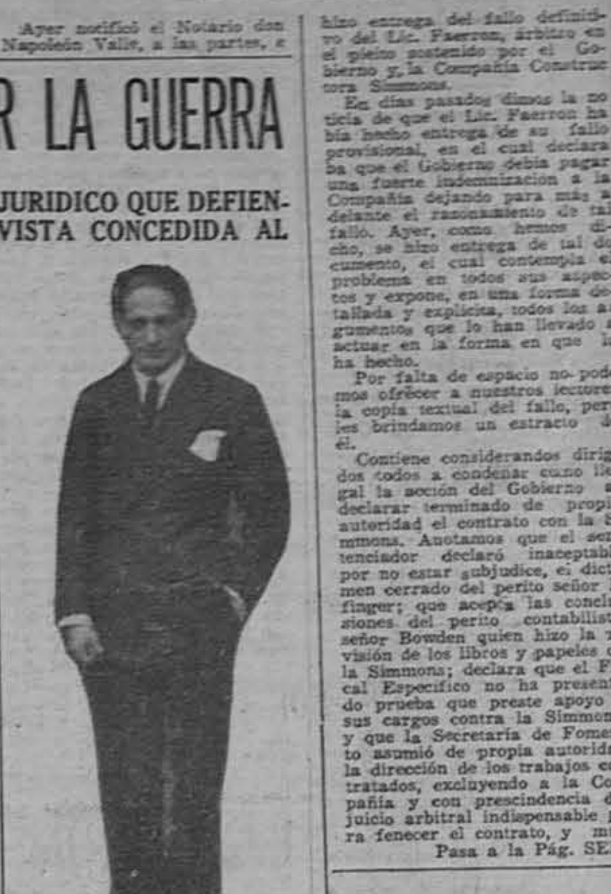
DR. JORGE ELIECER GAITAN

El trabajo del Lic. Faerron es sumamente expedito y contempla el problema en todas sus partes, con el razonamiento de su actitud